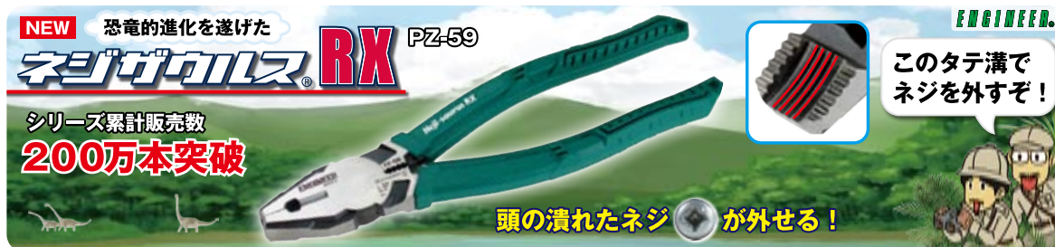
地下鉄御堂筋線車内のステッカー広告①

GTと比較すると全長が125%、対応ネジ頭径が160%、切断能力もアップし、薄板が確実に掴める独自形状のギア歯(意匠出願中)等々、ペンチとしての機能も強化。RXの開発秘話については、稿を改めてご報告いたします。